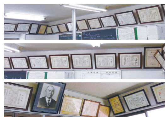
創業者と数々の賞状 (写真は一部)

れた耐火・不燃工事を主な業務としています。作業は吹き付けと左官業の技術を生かしたコテ塗りの両方です。 メーカーで得た材料の知識や現場経験の功績は大きく、北海道から沖縄まで全国をテリトリーに活躍、スーパーゼネコンと言われる最大手建設会社を中心に幅広いユーザーから信頼を得ています。 「着実に堅実に展開していくのが僕の役目、このまま持続し次の世代へ。現場を知る後継者を育てたい」と同社長は謙虚な姿勢を崩しません。 弊社とのお取引は2年くらいと短いですが「若い営業マンのフットワークが良くてアクションが早いですね」とお褒めいただきました。有難うございます。我々も100年企業を目指し堅実に頑張ります。